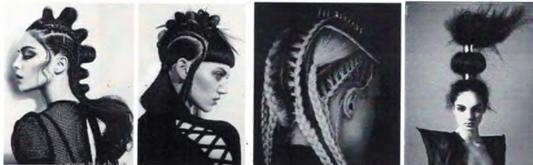
Рисунок 5,6,7,8, 9, (фото выше)