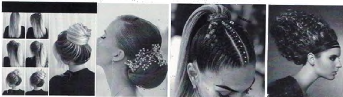
Рисунок 1,2,3,4, 5, (фото ниже)